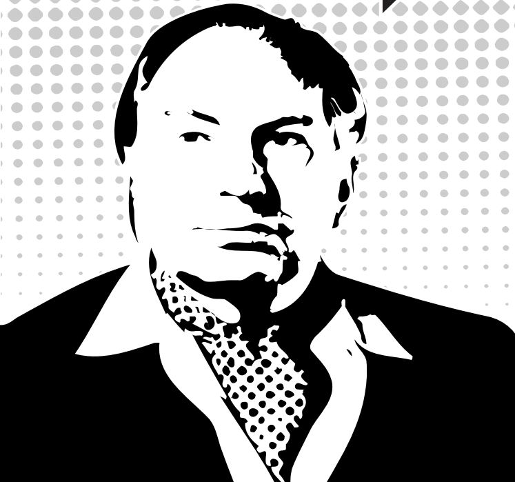
L. RON HUBBARD, SCIENCE-FICTION-AUTOR UND SCIENTOLOGY-GRÜNDER

“DER EINZIGE WEG, JEMANDEN ZU KONTROLLIEREN IST IHN ZU BELÜGEN. Notieren Sie sich das dick und fett. Der einzige Weg, jemanden zu kontrollieren ist ihn zu belügen.” 3